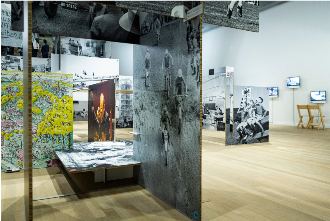
92 grossformatige Bilder; nicht aufgehängt an der Wand, sondern als Skulptur im Raum arrangiert. Chris Iseli / AGR