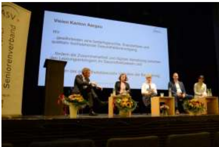
Bild: Themenanlass zur Gesundheitspolitik mit Teilnahme von RR Jean-Pierre Gallati und PolitikerInnen aus der Gesundheitspolitik.

aufzunehmen und gezielt weiterzuverfolgen. Einhellig bestand die Meinung, dass eine gute Gesundheitspolitik ohne Selbstverantwortung unserer Gesellschaft nicht realisiert werden kann.