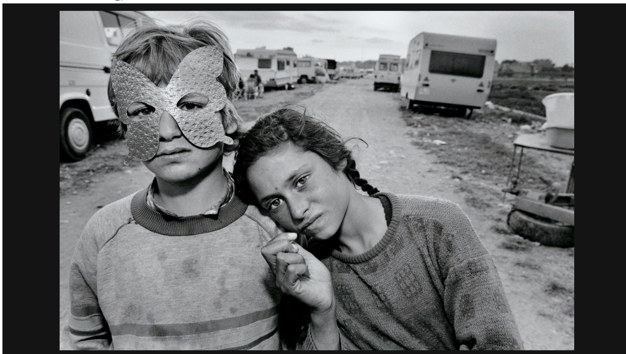
Eines der Bilder von Mary Ellen Mark aus der Reihe "The Lives of Women".