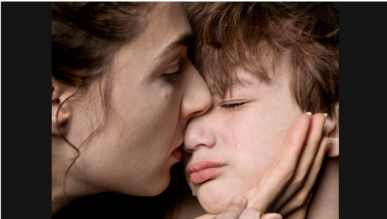
Ein Bild von Elinor Carucci aus der Fotoserie "Getting closer, Becoming Mother: About Intimacy and Family".