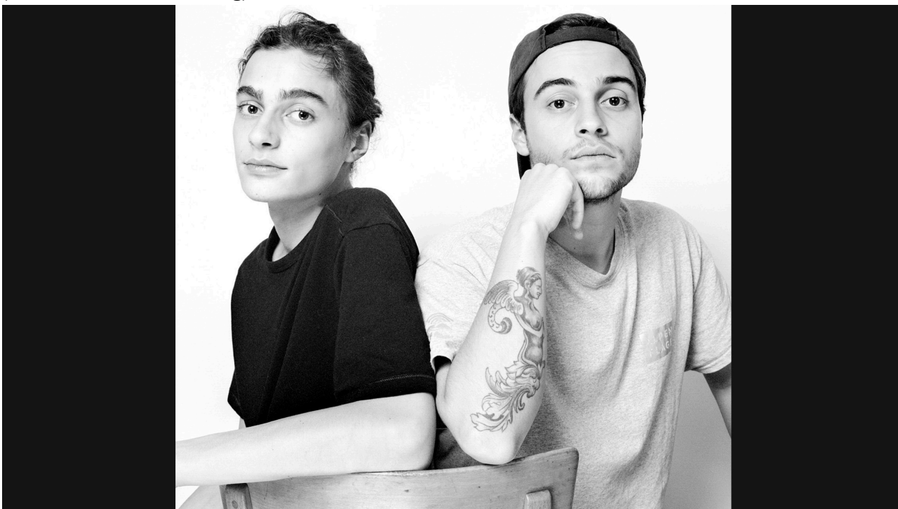
Ein Foto aus der Reihe "Rendez-Vous" von Caroline Minjolle.