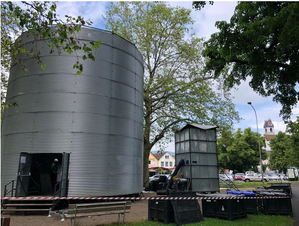
Nach eineinhalb Tagen Arbeit steht das Silo. Jetzt geht es im Innern an die Arbeit. Katja Schlegel

Zirkusfestival «cirqu'8» mit 14 verschiedenen Produktionen, verteilt in der ganzen Stadt, sowie einer Ausstellung im Stadtmuseum vom 10. bis 20. Juni in Aarau. Infos und Tickets auf www.cirquaarau.ch