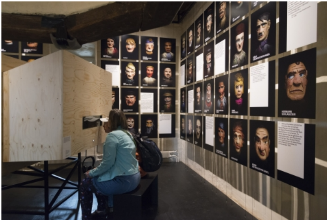
Dauerausstellung 100xAarau